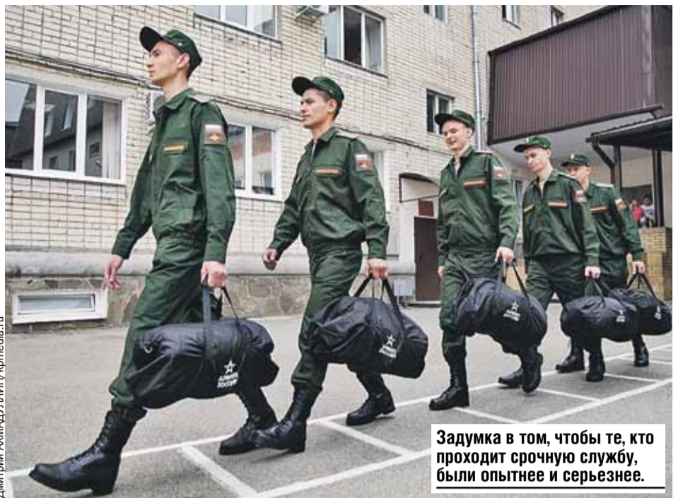
Задумка в том, чтобы те, кто проходит срочную службу, были опытнее и серьезнее.

И показал это на примере: весной призывали 147 тысяч человек, и для того, чтобы эта цифра была устойчивой и было кого отбирать, расширяют границы.