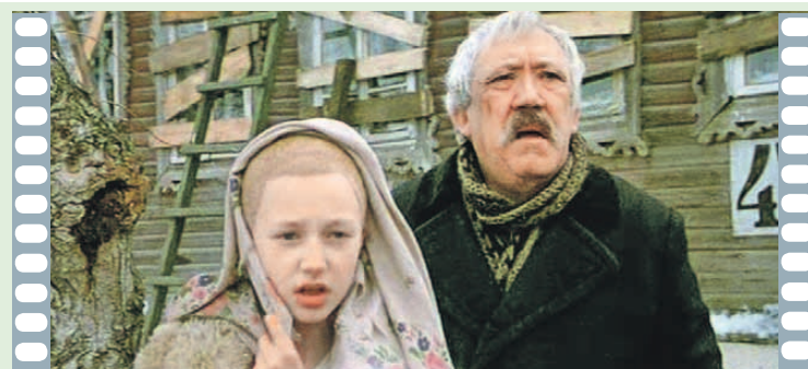
Герои «Чучела», Лена Бессольцева (Кристина Орбакайте) и ее дедушка ( Юрий Никулин ), живут именно в городе на Оке.