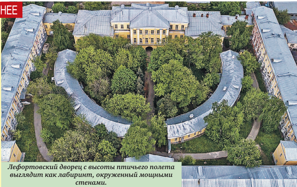
Лефортовский дворец с высоты птичьего полета выглядит как лабиринт, окруженный мощными стенами.

короне. Первый адмирал флота Российского, любитель выпивки и танцев - его еще при жизни царедворцы за глаза называли не иначе как «чертушкой». Страстью Лефорта была алхимия - все искал рецепт эликсира бессмертия. Может, и нашел? Во дворце, где он жил, до сих пор слышатся загадочные шаги, уверяют работники расположенного в здании Военно-исторического архива. По их словам, дух адмирала шаловлив и безобиден. Бывает, порой со своего места на стеллаже вдруг исчезает папка с архивными бумагами. Сотрудники знают: Лефорт забавляется, пошуршит и обязательно вернет. И точно - на следующий день папка вновь на месте.