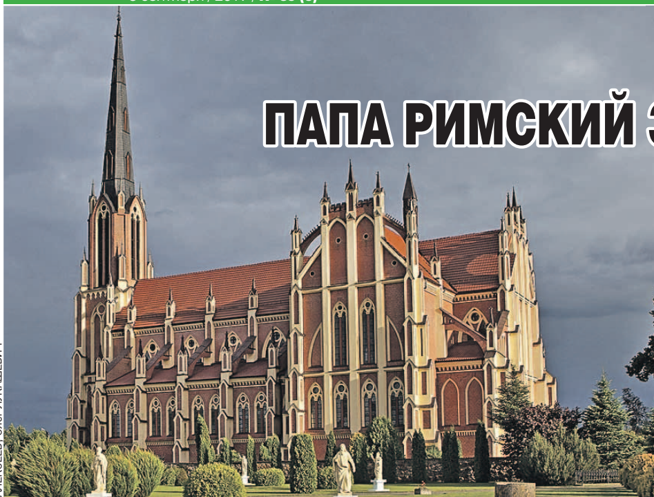
Костел в Гervятах в неоготическом стиле - красивейший памятник архитектуры и искусства в Гродненской области - построен в начале 1900-х годов.