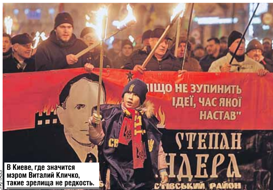
В Киеве, где значится мэром Виталий Кличко, такие зрелища не редкость.

Тема для нас будет закрыта на многие годы. Необходимо это учитывать. В конце концов, на прошлых выступали в нейтральном статусе, но весь мир знал, что мы - русские. Даже без флага и гимна.