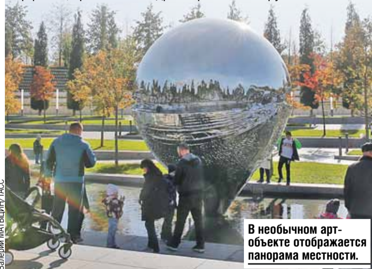
В необычном арт-объекте отображается панорама местности.

А в прошлом октябре тут появился целый город с призрачными колоннами. Итальянские мастера создали его из тонкой проволоки и удивили всю Россию. За счет иллюзии перспективы и оптической игры воздушная конструкция выглядит как осязаемая проекция руин. В ней соединены древнегреческий Парфенон, храм Весты и древнеримский Форум.