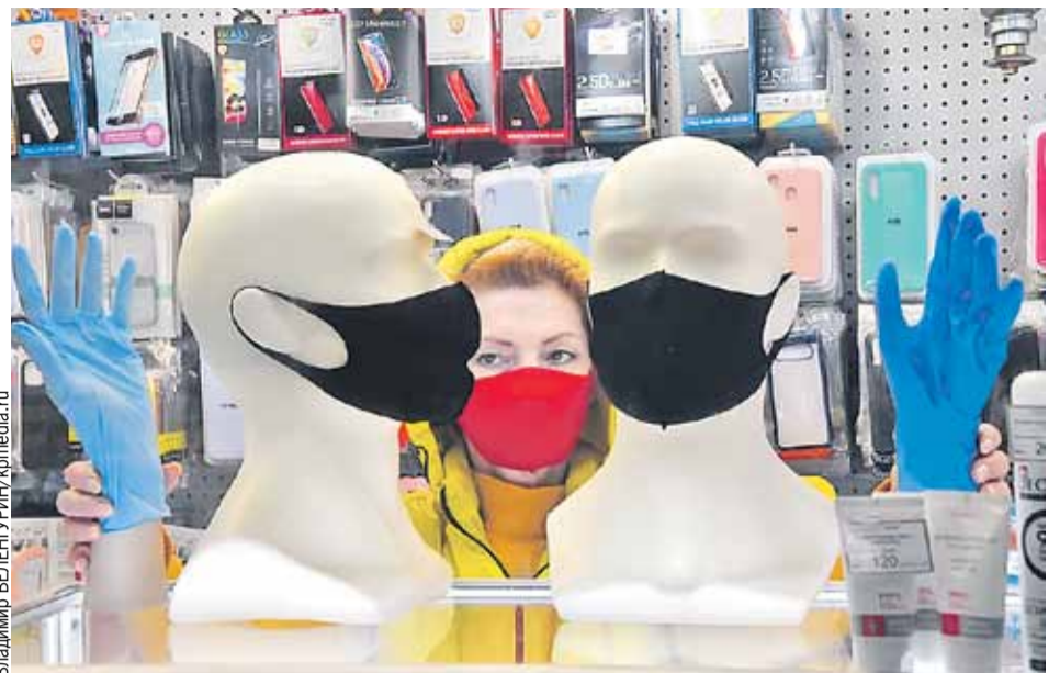
Обычные маски теперь предлагают заменить на хирургические.

Причем в зоне риска также подростки, которые находятся в возрасте проявления аутоиммунных и эндокринных заболеваний. В России уже на следующей неделе их начнут прививать от коронавируса. Вакцини-