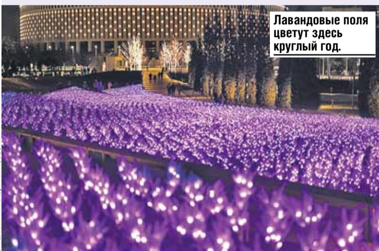
Лавандовые поля цветут здесь круглый год.

Еще одно необычное дерево получило прописку в разгар первой волны коронавируса и локдауна. Из Южной Америки привезли хоризию, или, как ее еще называют, сейбу. Ствол дерева усыпан большими колючками, а во время дождей оно скапливает в себе воду и становится похожим на бутылку. Отсюда еще одно имя - бутылочное дерево. К слову, растения в парке высажены с тонким расчетом. Их цветение создает особую атмосферу и мягкую гамму красок. Здесь столько лаванды, что можно легко представить себя на бескрайних полях французского Прованса.