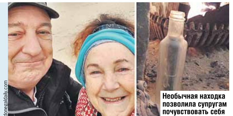
Необычная находка позволила супругам почувствовать себя как в кинофильме.