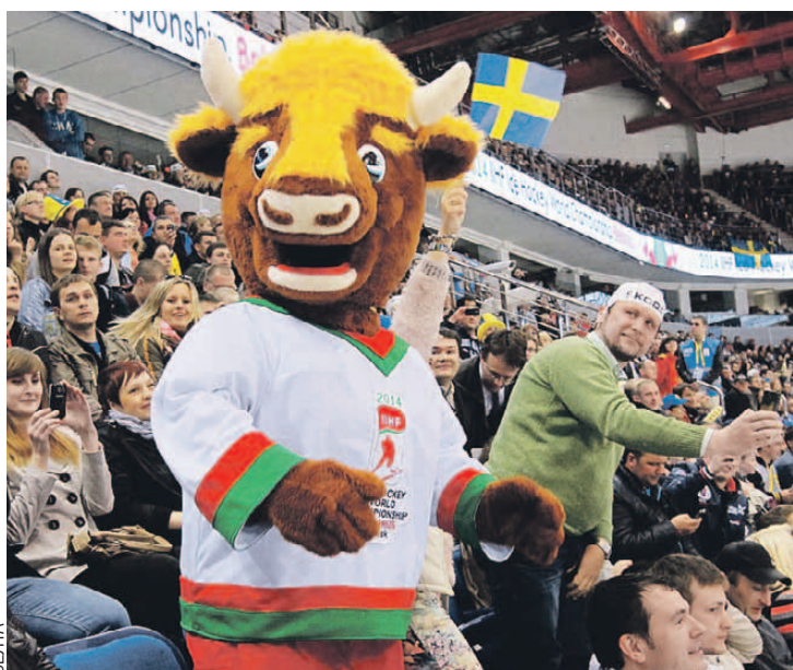
Талисман чемпионата мира-2014 зубр Волат (Богатырь) стал счастливым для сборной Олега Знарка, завоевавшей тогда «золото».

- Привет, Кельн, - помахал рукой с огромного экрана Олег Новицкий. - Обожаю хоккей, жаль, не могу на станцию взять клюшку. За-