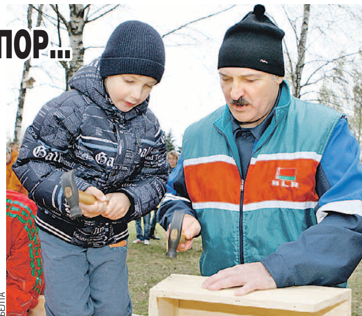
Александр Лукашенко сам умеет с инструментом обращаться и мальчишек научит.

Аналогичная ситуация и с физкультурой. Глава государства обратил внимание, что детям надо прививать здоровый образ жизни, обучать различным видам спорта.