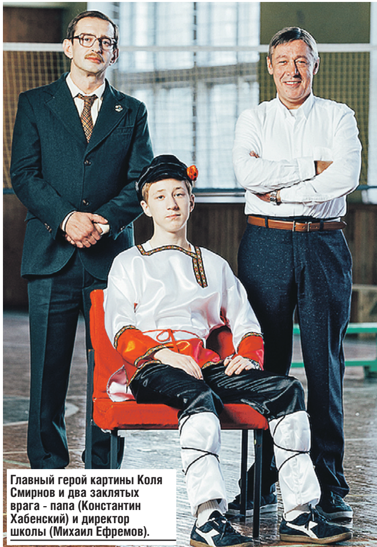
Главный герой картины Коля Смирнов и два закланных врага - папа (Константин Хабенский) и директор школы (Михаил Ефремов).

- Сложности возникают всегда, вне зависимости от «звездности», статуса или возраста актера. Михаил Ефремов и Константин Хабенский - сложные, харизматичные личности. Ефремов на съемках всех строил. Сразу поняла, что с ним нужно, чтобы все было быстро. Иначе начнет критиковать. Еще Ефремов веселый, и с ним важно все время отшучиваться. Если пошутил, ждет, чтобы кто-нибудь ответил тем