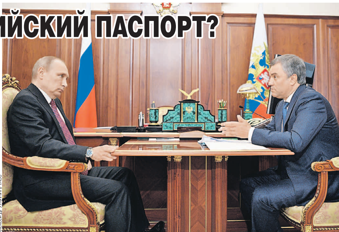
На встрече со спикером Госдумы Вячеславом Володиным Президент РФ Владимир Путин поддержал инициативу лишать гражданства террористов.

- Нужно проконсультироваться с Конституционным