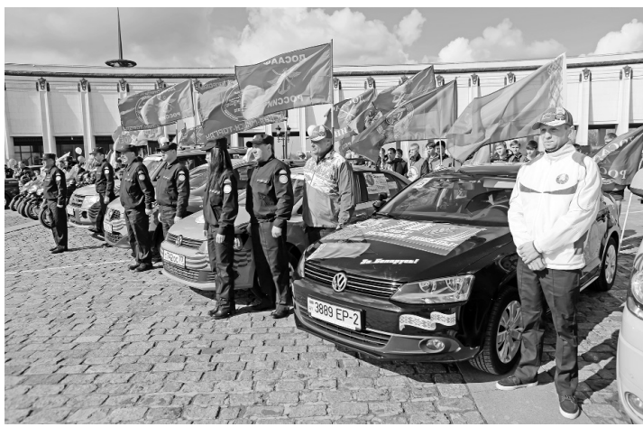
Окончание. Начало на стр. 1

— Проедут по той территории Российской Федерации и Республики Беларусь, где история Великой Отечественной войны оставила след блестящей победой в 1944 году. Это операция «Багратион», когда за два месяца была разгромлена немецкая группировка «Центр» и освобождена территория Беларуси. Но в то же время участники автопробега узнают лишний раз, что Беларусь в годы войны потеряла каждого третьего жителя. Они побывают в тех местах, где располагались концентрационные лагеря, еврейские гетто, где уничтожались мирное население. И самое главное, вот сейчас уже, помимо того чтобы