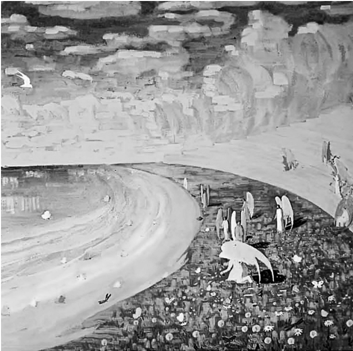
Микалоус Чюрлёнис. «Рай»