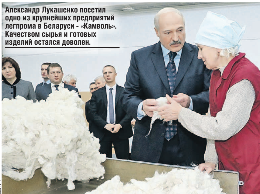
Александр Лукашенко посетил одно из крупнейших предприятий легпрома в Беларуси - «Камволь». Качеством сырья и готовых изделий остался доволен.

сти свою ответственность. Уверен, что без России мировой спорт обднечет. Поэтому Россия все равно будет в олимпийском и мировом спортивном движении. В этом я на сто процентов убежден. Все в руках самой России и прежде всего спортсменов России. Спортсмен,