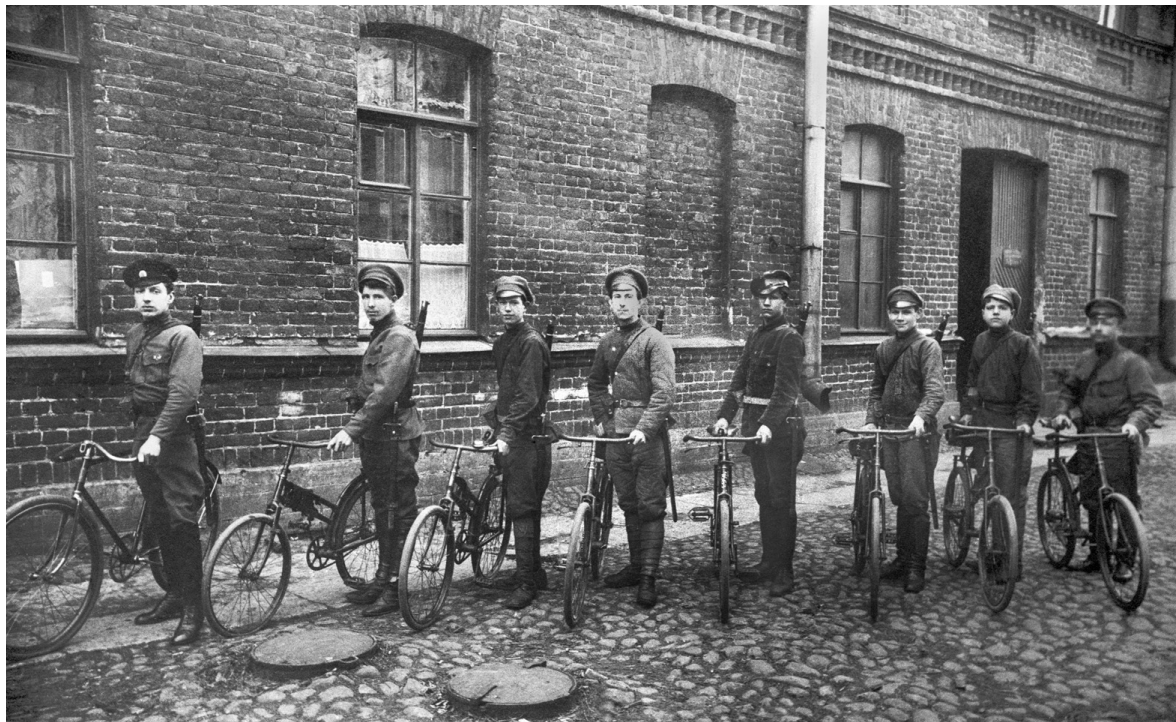
Санкт-Петербург. Команда самокатчиков (фельдъегерей). 1918 г.

Несмотря на бурное развитие информационных технологий, служба фельдъегерей в Беларуси и России остается весьма востребованной