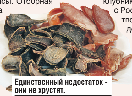
Единственный недостаток - они не хрустят.

соком, сушками и колбасой. А потом спели пару любимых хитов и сделали селфи с гостями.