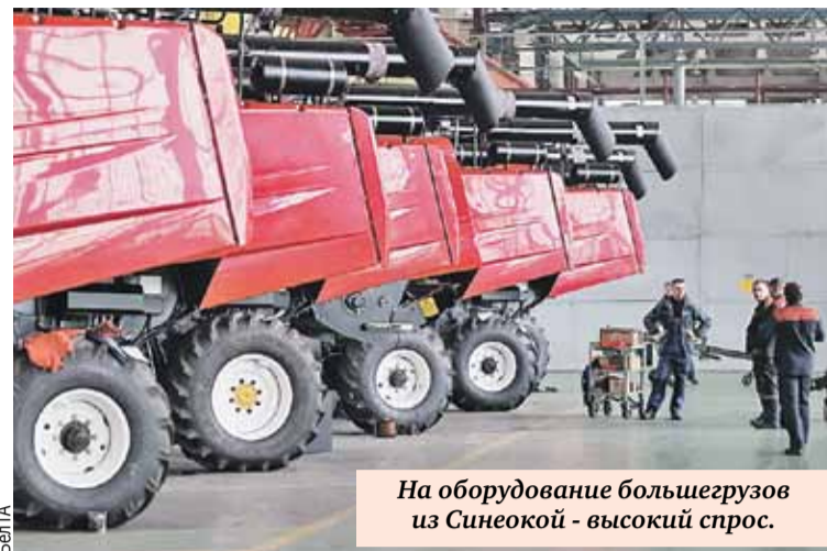
На оборудование большегрузов из Синеокой - высокий спрос.