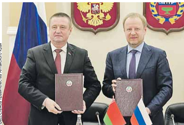
Губернатор Виктор Томенко (справа) тепло принял белорусскую делегацию во главе с вице-премьером РБ Леонидом Зайцем (март 2023 года).

Пресс-служба правительства Алтайского края