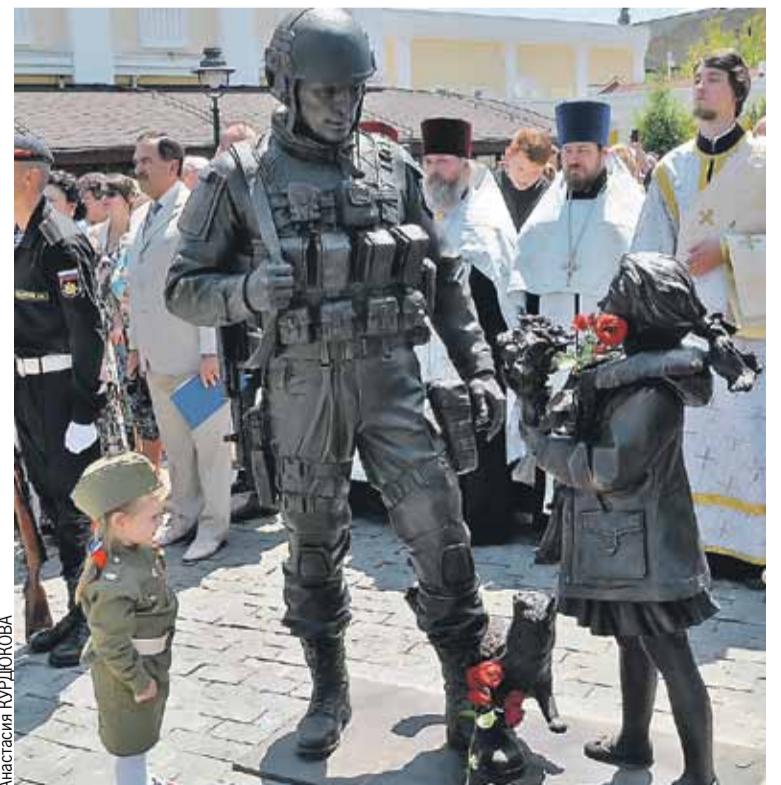
Памятник специально сделали без постамента, чтобы приблизить к людям.

Считается, что полуостров взяли под контроль без единого выстрела. Но открывать огонь все-таки пришлось. Правда, всего один раз - во время захвата военной части 1-го батальона морской пехоты ВМСУ в Феодосии. Батальон участвовал в операциях НАТО, был самым замотивированным и наиболее подготовленным проукраинским подразделением. Полноценная схватка с ним могла привести к потерям и затормозить процесс интеграции Крыма с Россией. Поэтому взяли украинских военных с налета. Ночью наш спецназ устроил пальбу по стенам здания, ворвался внутрь, приказав сдаваться. Ошеломленные стремительным натиском украинцы сопротивления не оказали. Никто из них не пострадал. Позже все они организованно покинули полуостров. Потери батальон понес потом, когда начал принимать активное участие в так называемом АТО - карательной операции на территории ДНР и ЛНР. Но это уже совсем другая история.